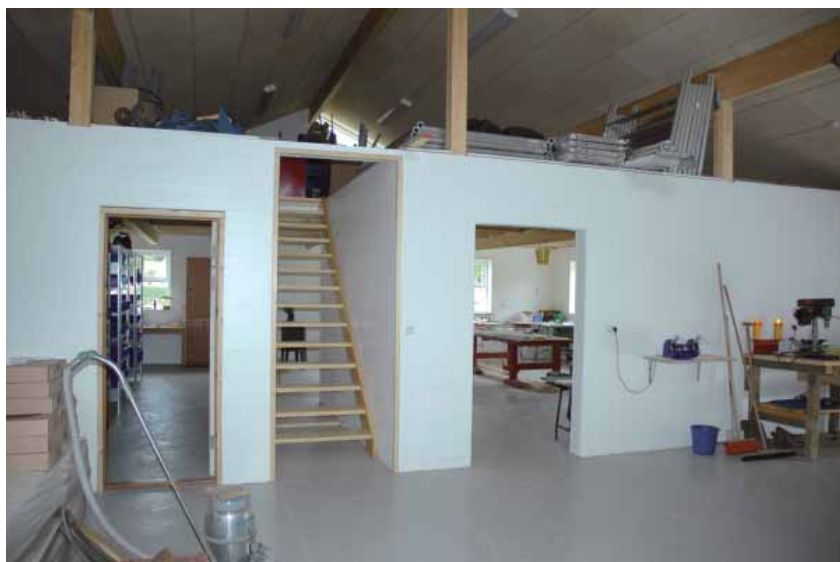
Interiør fra værksted

Vi har fået et rigtig godt arbejdssted som basis for de kommende mange års forbedringer og udbygninger i centret, der i dag omfatter mere end 40 større eller mindre bygninger. Samtidig har vi fået en hårdt tiltrængt udvidelse af de lager- og opbevaringsfaciliteter, som er så nødvendige i et center af denne størrelse.